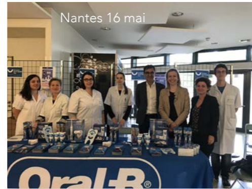
Nantes 16 mai

Oral-B a noué avec la SFPIO un partenariat il y a presque 20 ans. Chaque année, nous menons ensemble des actions de prévention ainsi que des programmes tournés vers une amélioration de l'hygiène bucco-dentaire au service d'une meilleure santé parodontale. Depuis 2 ans, Oral-B et la SFPIO organisent, à la Faculté dentaire de Montpellier, une journée conférence multidisciplinaire à l'occasion de la journée européenne de la Parodontologie sur le thème des liens entre santé générale et santé parodontale.