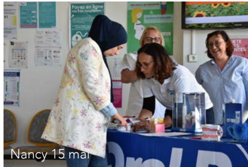
Nancy 15 mai

L'EFPP (European Fédération Of Peridodontology) mène depuis plusieurs mois, avec Oral-B, au niveau Européen une campagne de sensibilisation sur les liens entre santé parodontale et grossesse. La SFPIO et Oral-B ont voulu la relayer en France en menant conjointement une campagne de prévention nationale.