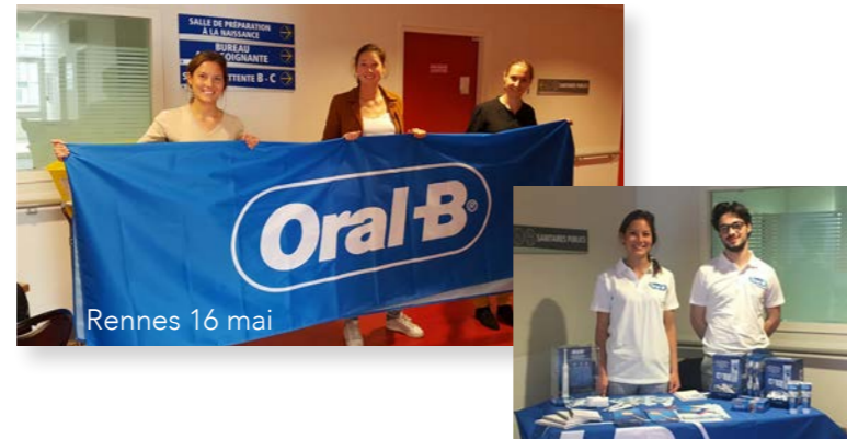
Rennes 16 mai